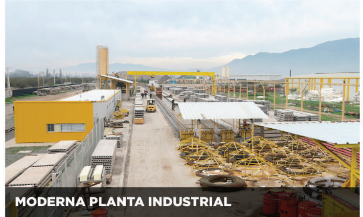
MODERNA PLANTA INDUSTRIAL