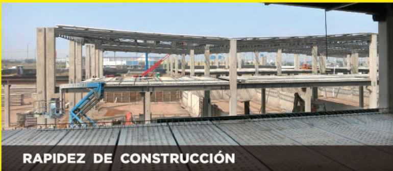
RAPIDEZ DE CONSTRUCCIÓN