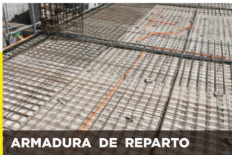
ARMADURA DE REPARTO