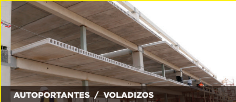
AUTOPORTANTES / VOLADIZOS