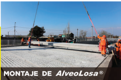
MONTAJE DE AlveoLosa®

AlveoLosa® es un elemento estructural prefabricado de hormigón pretensado, en forma de placa, aligerado por alvéolos longitudinales. Este sistema de losas pretensadas es recomendado para entresijos de grandes luces y sobrecargas en edificios de gran altura o extensión, edificios habitacionales, deportivos, colegios, hospitales, centros de bodega, estacionamientos, entre otros.