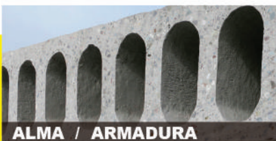
ALMA / ARMADURA

Los Alveolos longitudinales reducen el peso propio y mejoran la aislación de la losa.