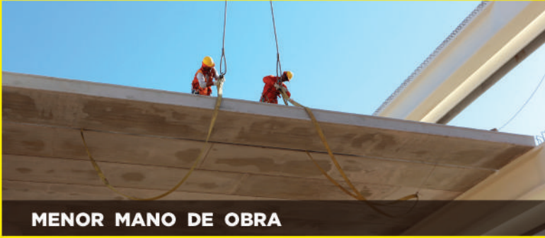
MENOR MANO DE OBRA