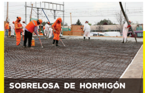
SOBRELASA DE HORMIGÓN